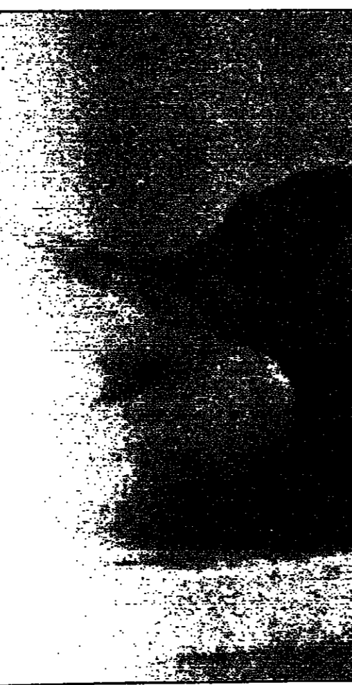
جثمان وزير دفاع كوسوفو، احمد كراستيفي سبجي في احد مستشفيات تيرانا عقب اغتياله

سيام ريب (كمبوديا) - اف ب - التقى اطراف الكمبوديون المتنازعين ووجها لوجه امس الثلاثاء في سيام ريب (شمال) للمرة الاولى منذ اكثر من ستة ايام في مفاوضات في ماسينونك في محاولة لحل النزاع على السلطة. وكانت وساطة المجموعة قد اشاروا الاثنين الى احتمال التدخل في ليسوتو بعدما اتمت حكومة ماسيرو للعارضة ووتيزي للثنام بالقيام بعمليات. وقد صرح رئيس الوزراء باكاليشا موسيسيلي ان امام حكومة ليسوتو خيار للجوء الى مساعدة بريطانيا (سادك) اذ لم تتمكن من حل مشكلاتها الداخلية. و اضاف في مقابلة مع وكالة انباء جنوب افريقيا ان تقرا لضرورة إعادة النظام والوضع الطبيعي الى